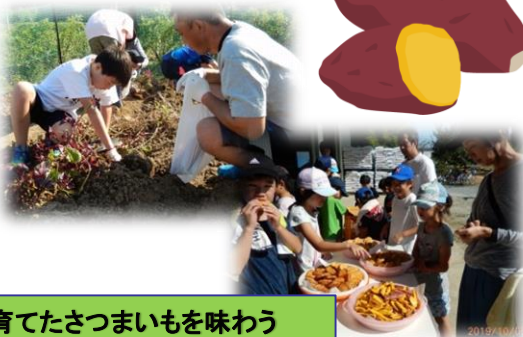
育てたさつまいもを味わう