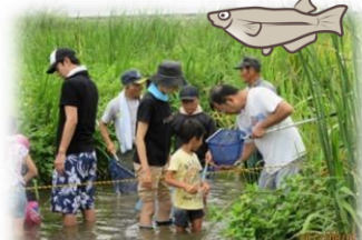
子供たちと魚を捕まえて