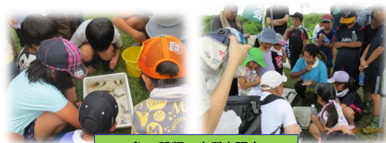
魚の種類で水質を調査