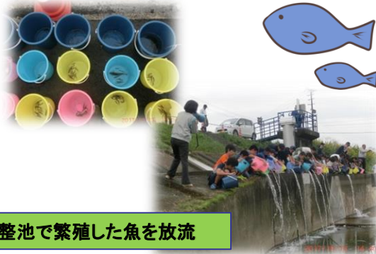
調整池で繁殖した魚を放流