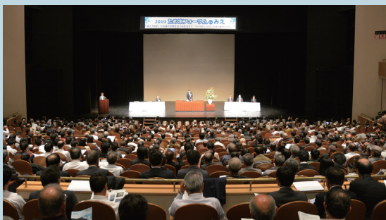
「2019ため池フォーラムみえ」(津市)

ため池の保全・管理などの様々な情報を発信し、適正管理に向けた普及啓発を行います。